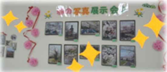
どれも素敵な写真ばかりです😊

後日、氷見校では、その時の写真を集めて春の展示会を開きました。参加できなかった方も、「キレイやねー」「これは誰が撮ったの?」など、会話に花が咲いていました。